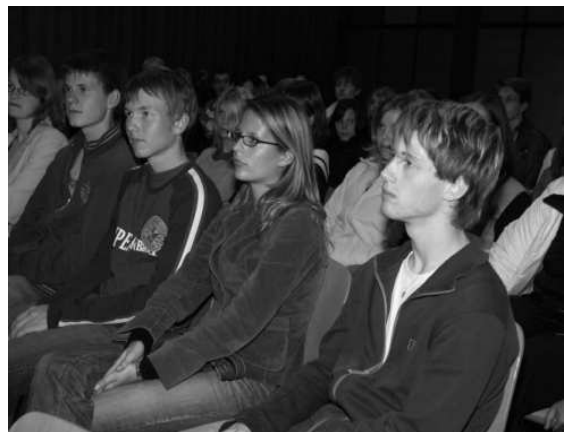
Die gespannte Zuhörerschaft lauscht

noch einmal fünfzig Mann den Saal stürmen und sich mit den Schauspielern mit der Thematik des Stücks befassen und damit, was es heißt, den Beruf Schauspieler zu leben. Die Probezeit für ein Stück nimmt für eine Schauspielergruppe bei der Badischen Landesbühne etwa sechs Wochen in Anspruch, wobei in dieser Zeit vormittags auf den Brettern gestanden wird, nachmittags man meist schon auf dem Weg zum nächsten Ort ist – je nachdem wie weit weg – und abends dann die Aufführung des Stücks aus den zurückliegenden Proben. Text lernen? Möglich nur dazwischen. Ein anstrengender Job! „Aber auch eine Herausforderung!“, so